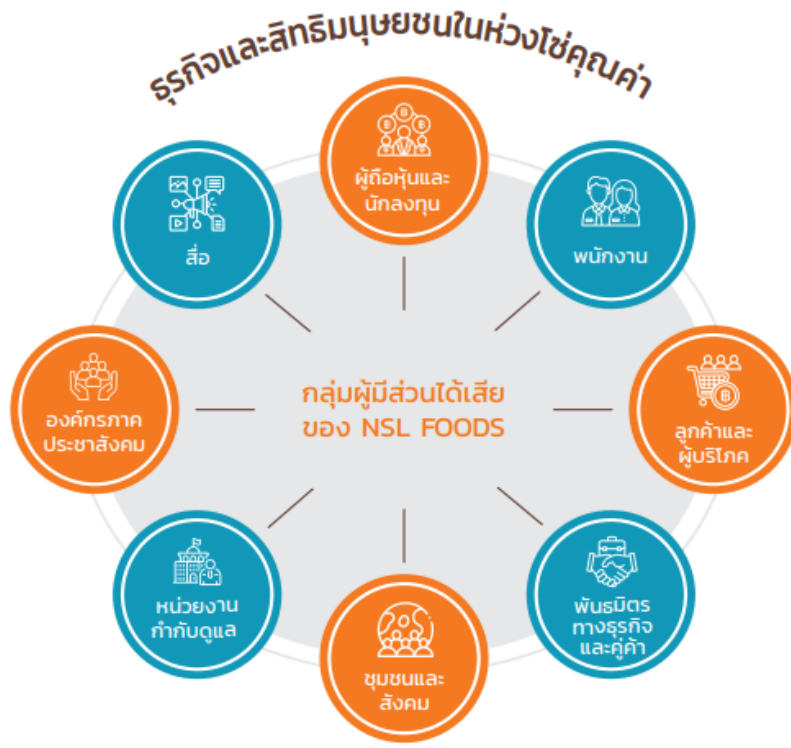
ธุรกิจและสิทธิมนุษยชนในห่วงโซ่คุณค่า